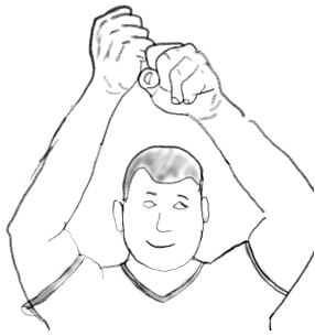
(a) Zeichen für Bossa